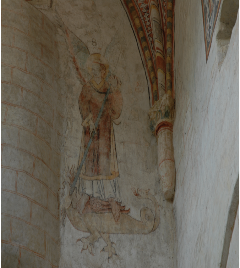
Eine fast tausendjährige Darstellung in der Kirche von Romainmotier